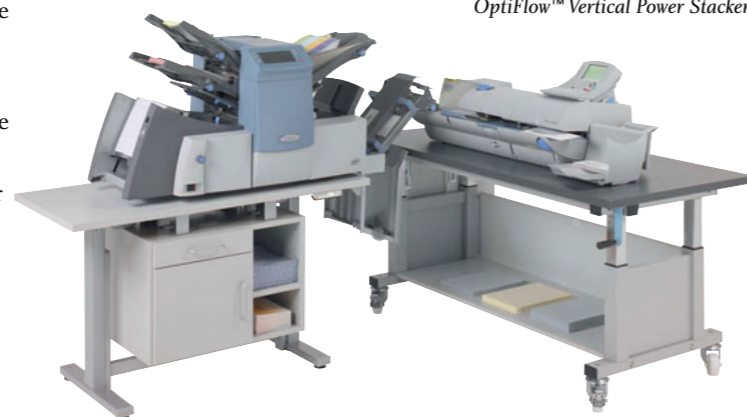
Få en tidsbesparende og optimal løsning ved at kombinere en DI 425 med et DM 550 frankeringssystem