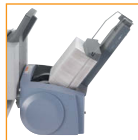
OptiFlow™ Vertical Power Stacker